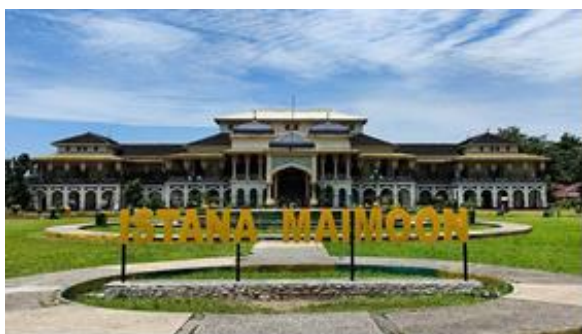
Gambar 2. Istana Maimun

Gelar Melayu Serumpun juga menjadi alat strategis untuk menarik wisatawan dari berbagai tingkat, baik lokal, domestik, maupun internasional, untuk berkunjung ke Kota Medan. Dengan demikian, event ini tidak hanya memperkaya budaya tetapi juga mendukung pertumbuhan ekonomi dan pembangunan berkelanjutan di Kota Medan.