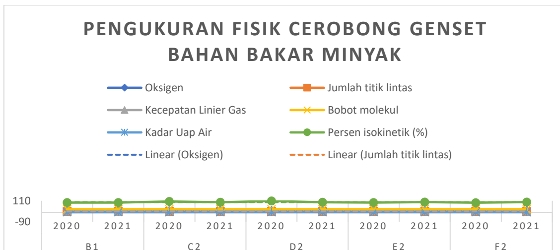
Gambar 3. Grafik Pengukuran Fisik Cerobong Genset Bahan Bakar Minyak

Didapatkan dari kedua data tersebut dapat dikatakan juga masih termasuk terkendali karena masih nilai tersebut dibawah ambang batas yang ditentukan berdasarkan Peraturan Menteri Negara Lingkungan Hidup No. 21 Tahun 2008 (Lampiran IV B Baku Mutu Emisi Sumber Tidak Bergerak Bagi PLTD) Bahan Bakar Minyak. Sehingga hasil pemantauan dapat menghasilkan data yang akan diolah menjadi grafik perbandingan antara tahun 2020 – 2021 seperti pada gambar grafik dibawah ini.