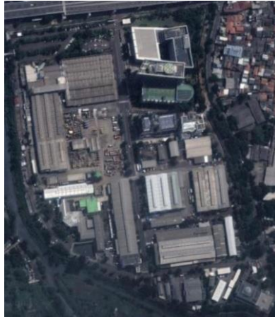
Gambar 1. Peta Lokasi Letak RTH di PT X

ditanam. Diketahui RTH yang terdapat di perusahaan tersebut terletak disepanjang bangunan. Dari peta lokasi PT X terlihat bahwa RTH yang ada mengelilingi disekitar bangunan.